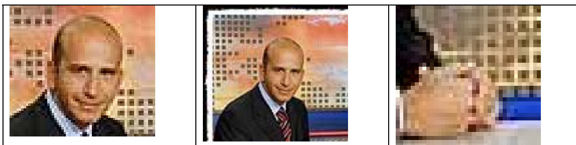
Primerisim primer pla