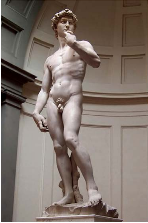
David , de Miquel Àngel