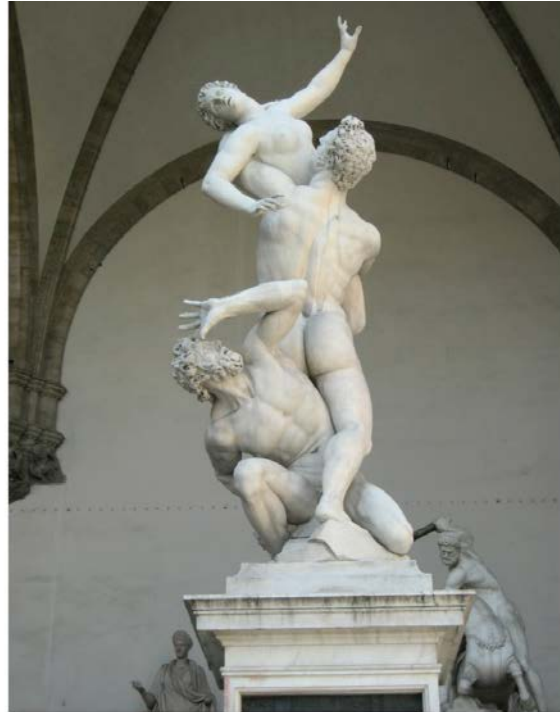
El rapte de les sabines , de Giambologna