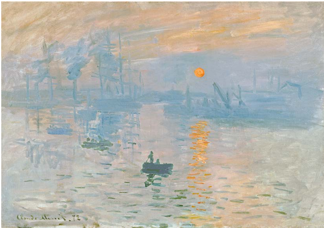
Impressió. Sol ixent , de Claude Monet