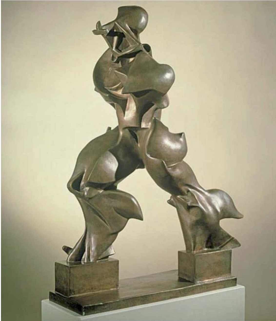
Formes úniques de la continuïtat en l'espai , d'Umberto Boccioni