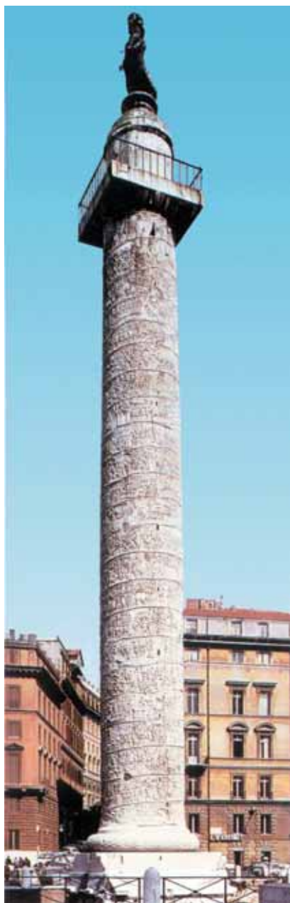
OBRA 2. Columna Trajana.