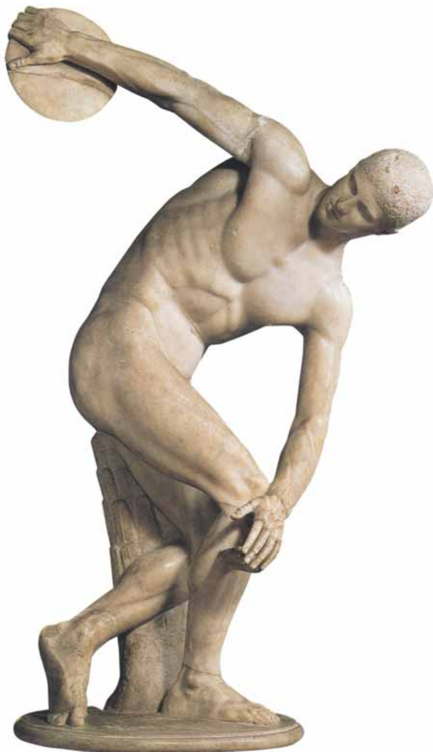
OBRA 2. Discòbol , de Miró.