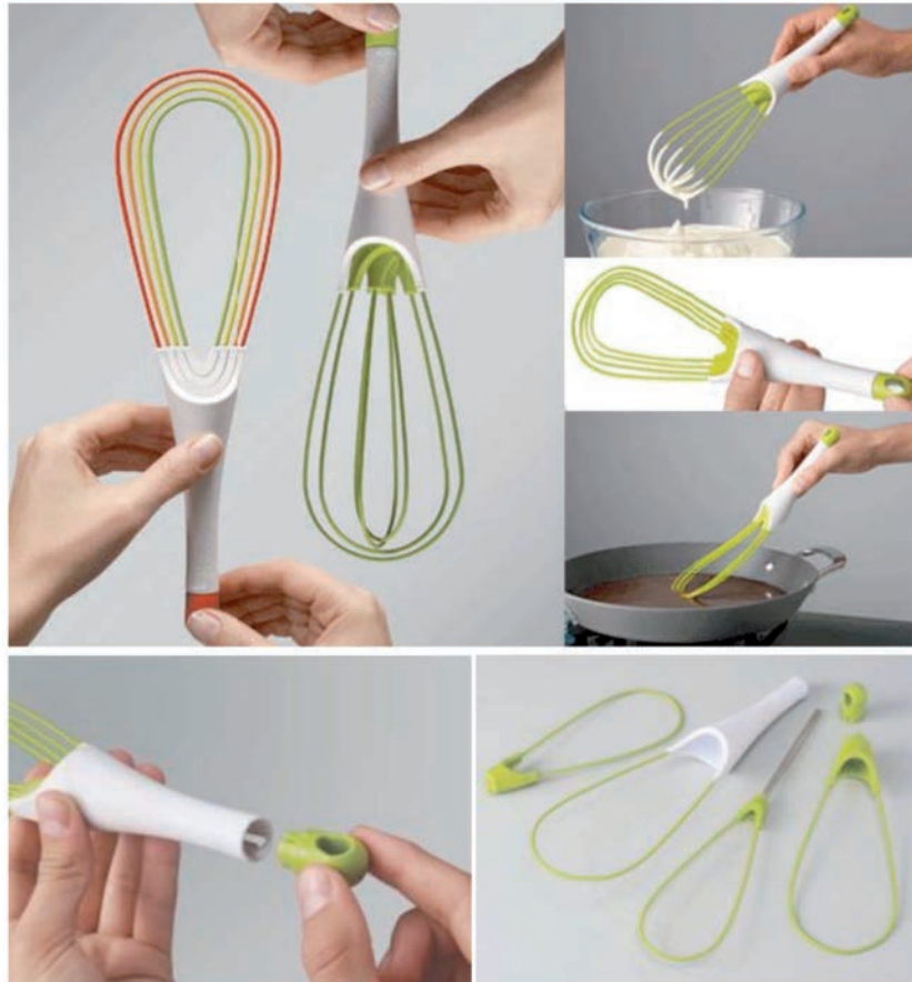
IMATGE B. Batedor Twist Whisk. Joseph Joseph

En la imatge B podem observar un batedor de varetes metàl·liques recobertes de silicona que es pot utilitzar en dues posicions diferents.