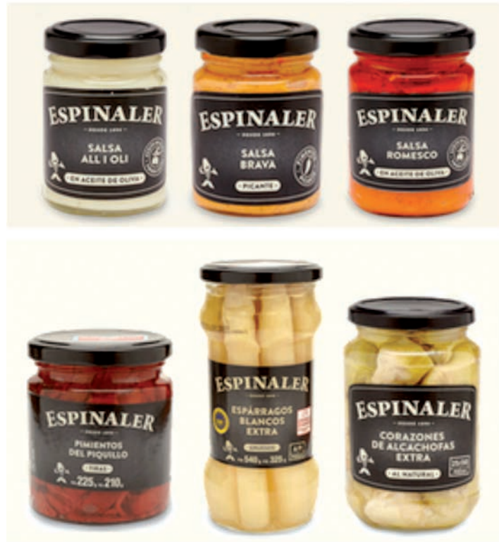
IMATGE D. Redisseny del packaging d'alguns productes Espinaler

Espinaler és una firma reconeguda de la gastronomia gurmètica catalana. La marca té més de tres-cents productes en el mercat de les conserves. Com a part del seu projecte d'expansió internacional, Espinaler va encarregar el redisseny integral de la seva imatge gràfica i del packaging de tots els seus productes. Observeu el disseny d'etiquetes de la imatge D i contesteu les preguntes que hi ha a continuació.