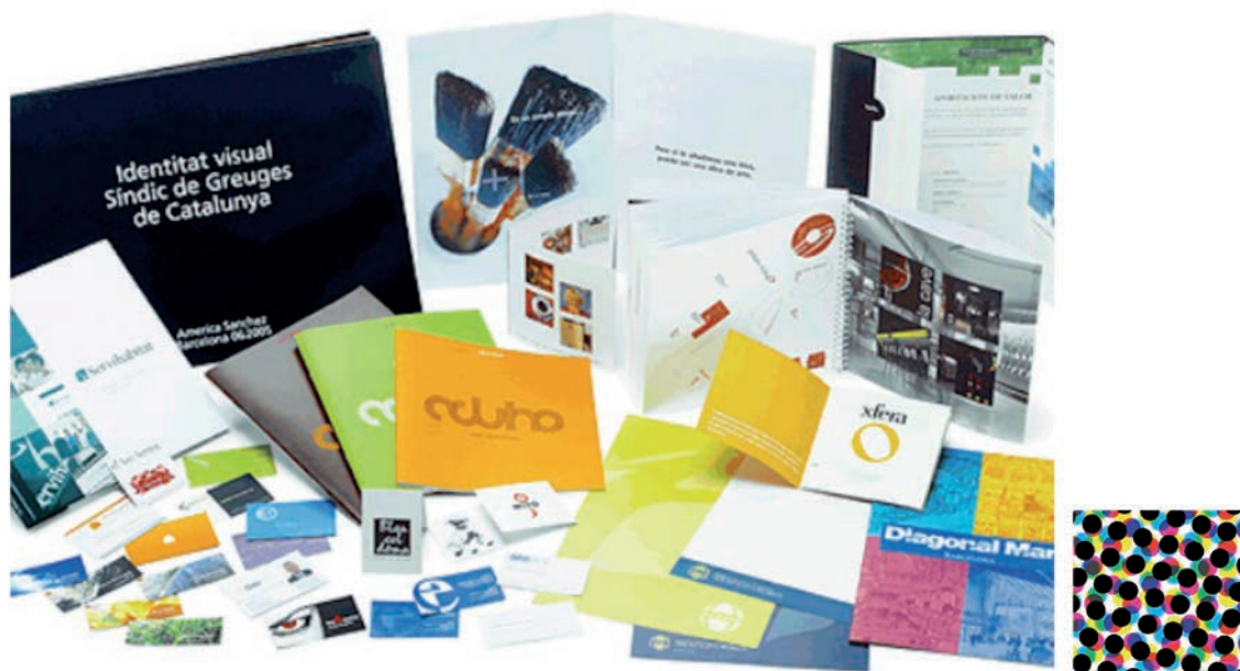
IMATGE A. Mostres d'impressió òfset i ampliació al 500 % d'un detall

La impressió òfset (en anglès, offset printing ) és una tècnica d'impressió que permet la reproducció de textos i imatges. Observeu la imatge A i contesteu les dues qüestions que hi ha a continuació.