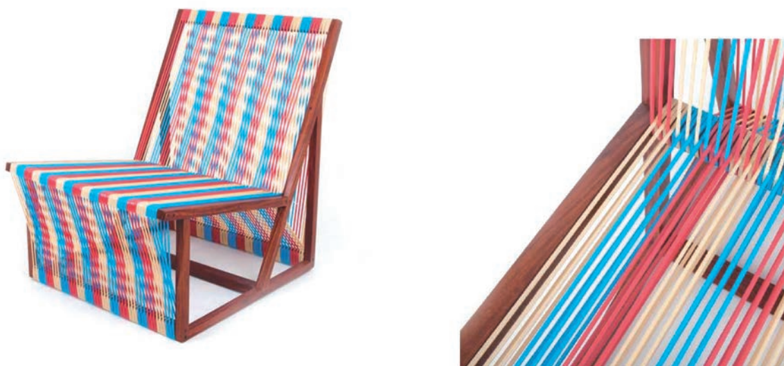
IMATGE E. Cadira Olga. Boulevard 03

Prenent aquesta cadira com a referent, desenvolueu el disseny d'un tamboret de bar. Per a fer-ho, podeu agafar com a referència les mides següents: 750 mm d'alçària, 330 × 330 mm de seient i 440 × 440 mm de base.