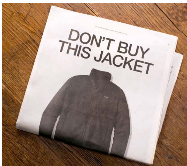
IMATGE B. Anunci a tota pàgina publicat a The New York Times , desembre del 2011