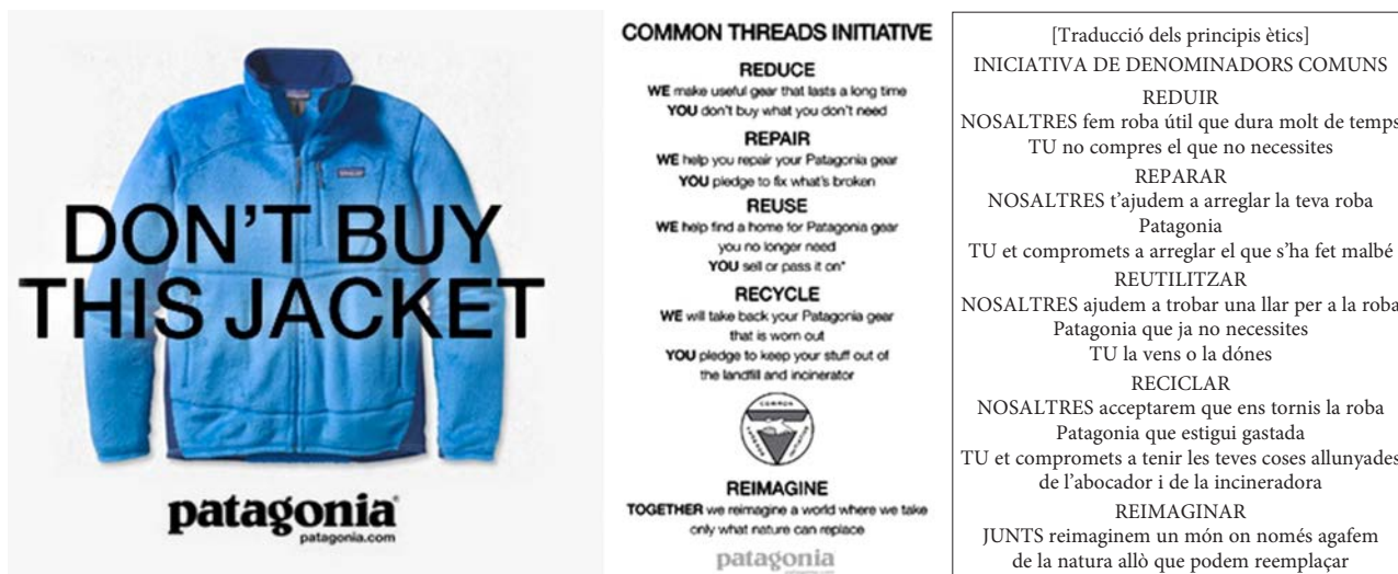
IMATGE A. Imatge publicitària de la campanya «Don't buy this jacket» («No compres aquesta jaqueta») i principis ètics de l'empresa Patagonia

Traducció i adaptació feta a partir del text de Mònica CARBONELL. «Patagonia: una marca que vende más pidiendo a sus clientes que compren menos». ESADECREAPOLIS [en línia] (13 setembre 2013)