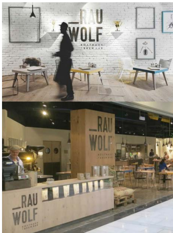
IMATGE F. A l'esquerra, dos espais de la cadena de cafeteries i, a la dreta, el logotip de l'empresa

La imatge F mostra la imatge gràfica de la cadena de cafeteries Rauwolf.