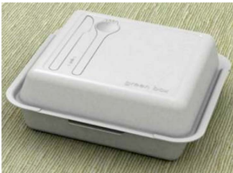
IMATGE C. Green Box . Pai Chang-Hsuan

Les mides d'aquest envàs són: 180 mm de llargària, 240 mm d'amplària i 100 mm d'alçària.