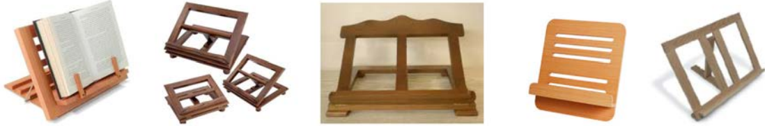
IMATGE G. Faristols de fusta amb diferents inclinacions per a posar sobre una taula

En la imatge G podeu observar diferents faristols de sobretaula per a llegir llibres.