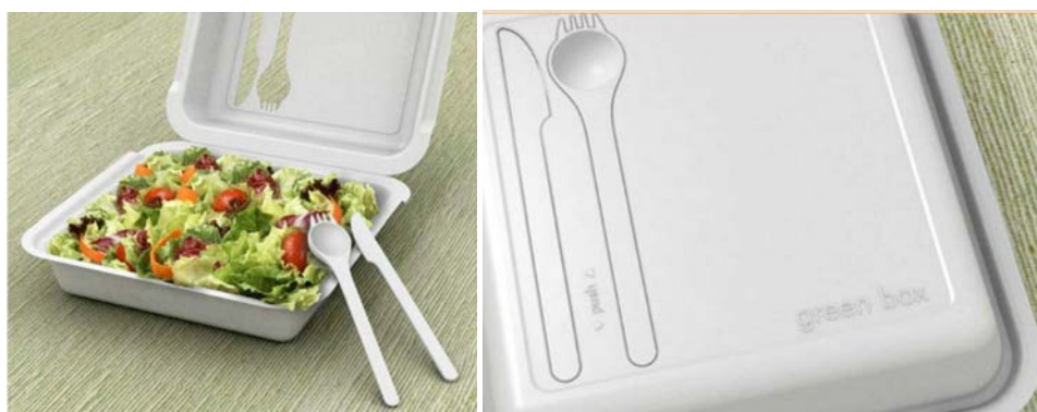
IMATGE D. Els coberts es poden separar fàcilment de l'envàs

Aquest envàs el proporcionen diversos restaurants que preparen menjar per a emportar-se. Un dels restaurants ha decidit fer una etiqueta per a enganxar-la a sobre de l'envàs, per tres motius: