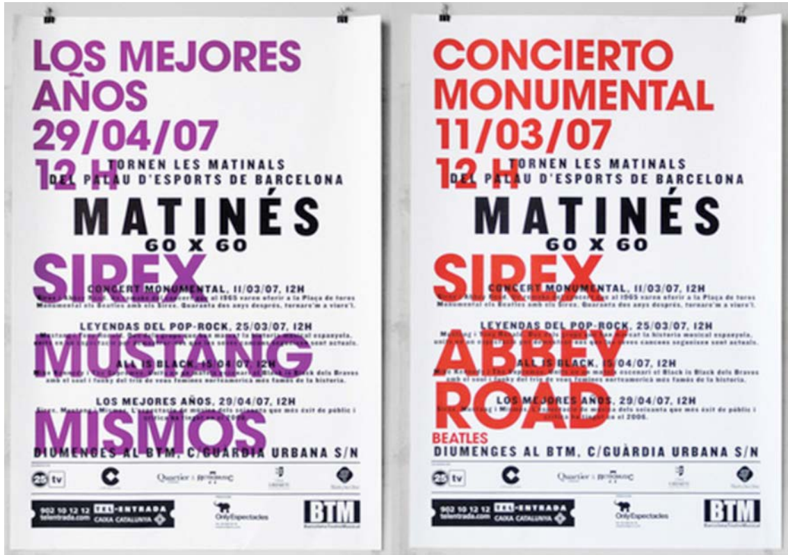
IMATGE F. Treballs gràfics de Miquel Polidano guardonats amb el premi Grand Laus, 2008

La imatge F mostra dos exemples de la imatge gràfica per als concerts matinals de l'antic Palau dels Esports de Barcelona (ara Barcelona Teatre Musical).