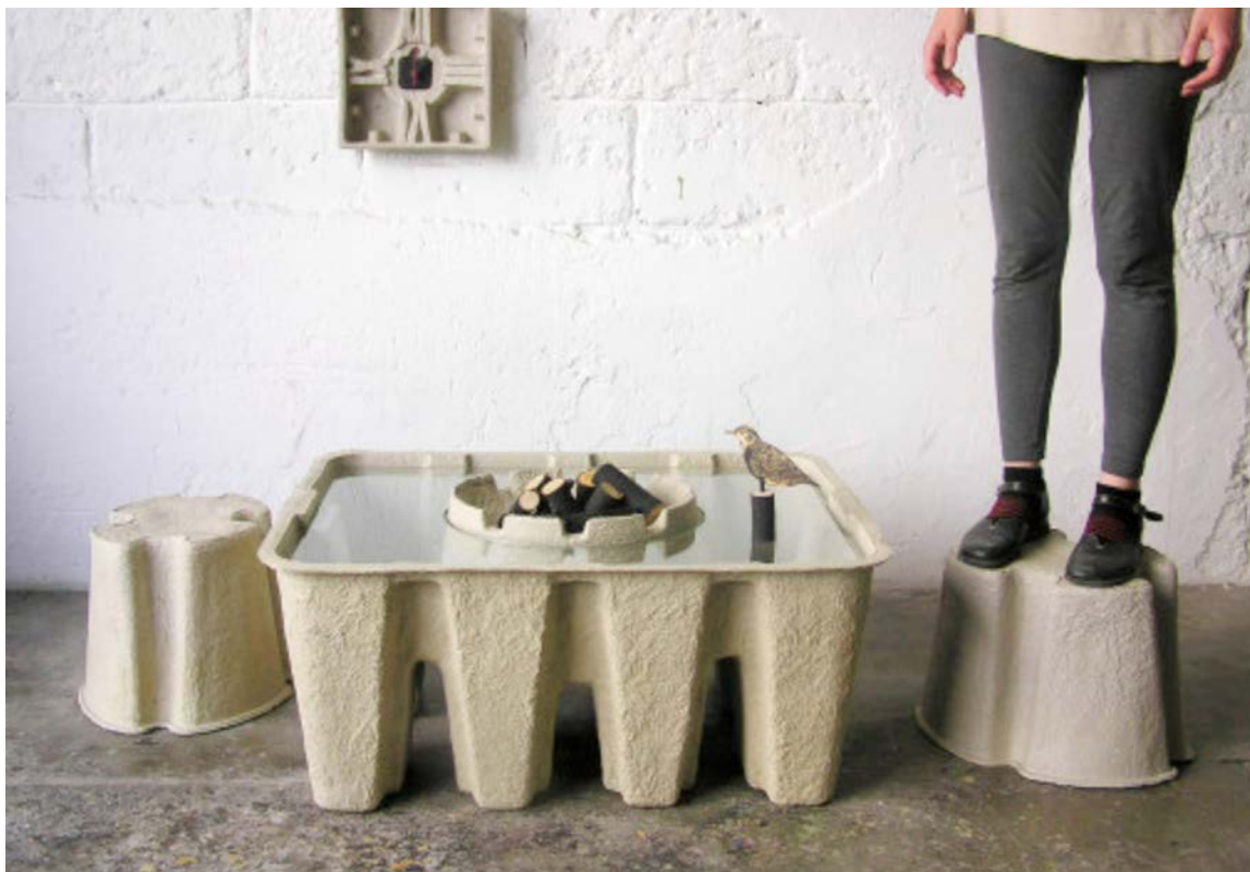
IMATGE A. Pulp Furniture . Dan Hochberg i Odelia Lavie, 2008

Comenteu els avantatges i els inconvenients que presenta aquest tipus de mobiliari tant per al medi ambient com per als usuaris.