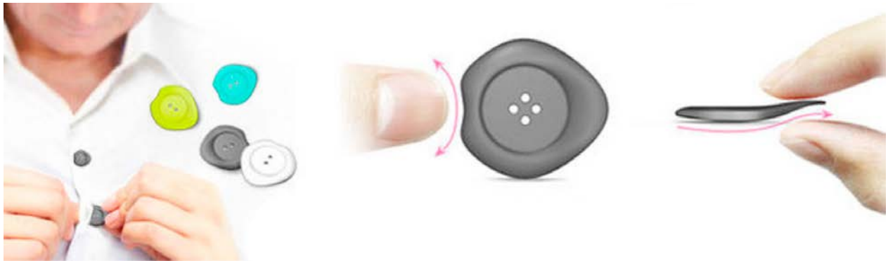
IMATGE D. Easy Button. 209 Studio

Observeu el disseny de botons proposat per a persones d'edat avançada de la imatge D.