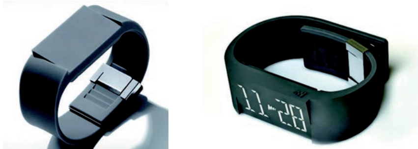
IMATGE F. Rellotge Mutewatch. Silicona negra. Els LED s'activen amb el tacte. Suècia

Fixeu-vos en la imatge F. Es tracta d'un rellotge de polsera fabricat amb silicona.