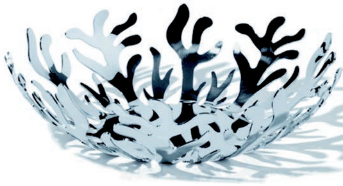
IMATGE A. Fruitera Mediterraneo . Emma Silvestris. Alessi. 29 cm