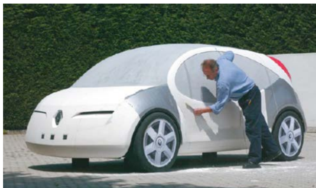
IMATGE A. Maqueta d'un automòbil Renault

La imatge A mostra un operari treballant en l'elaboració de la maqueta d'un automòbil i la imatge B, el prototip d'un automòbil presentat a la Fira de l'Automòbil de Frankfurt del 2013. Les dues representacions de vehicles corresponen a objectes tridimensionals, però hi ha algunes diferències entre l'una i l'altra.