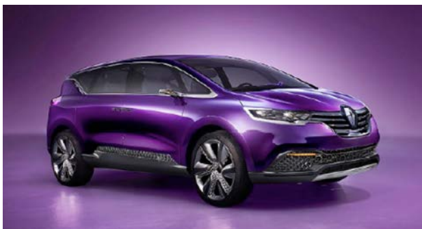
IMATGE B. Prototip del Renault Initiale presentat a la Fira de l'Automòbil de Frankfurt, 2013