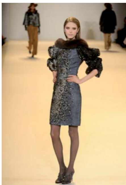
IMATGE E. Carolina Herrera, col·lecció tardor-hivern 2010-2011 a la Setmana de la Moda de Nova York.