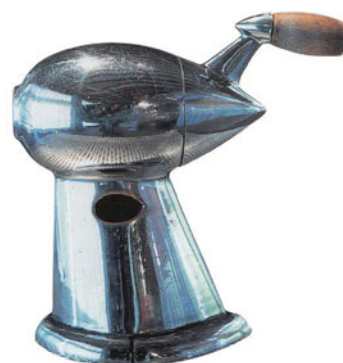
IMATGE B. Afilallapis. R. Loewy, 1934.