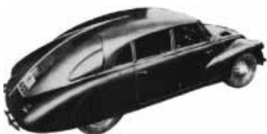
IMATGE A. Tatra V8. F. Porsche, 1938.