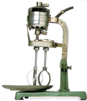
IMATGE A. Haushaltsmixer, 1918.