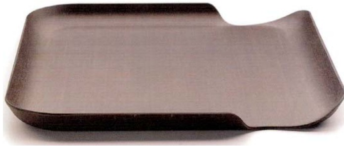
IMATGE F. Safata Delica, 2004.

Les mides totals de la safata són: 40 cm d'amplària, 30 cm de fondària i 3 cm d'alçària. El plàstic de la safata té un gruix uniforme de 3,5 mm.