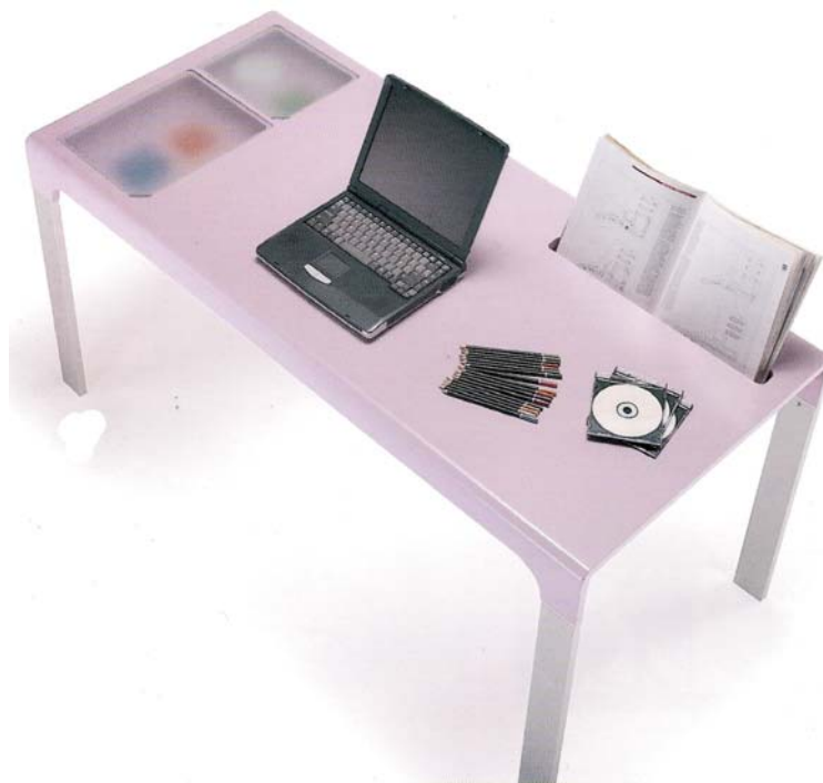
IMATGE D. Taula Work in Progress. Odosdesign, 2003.