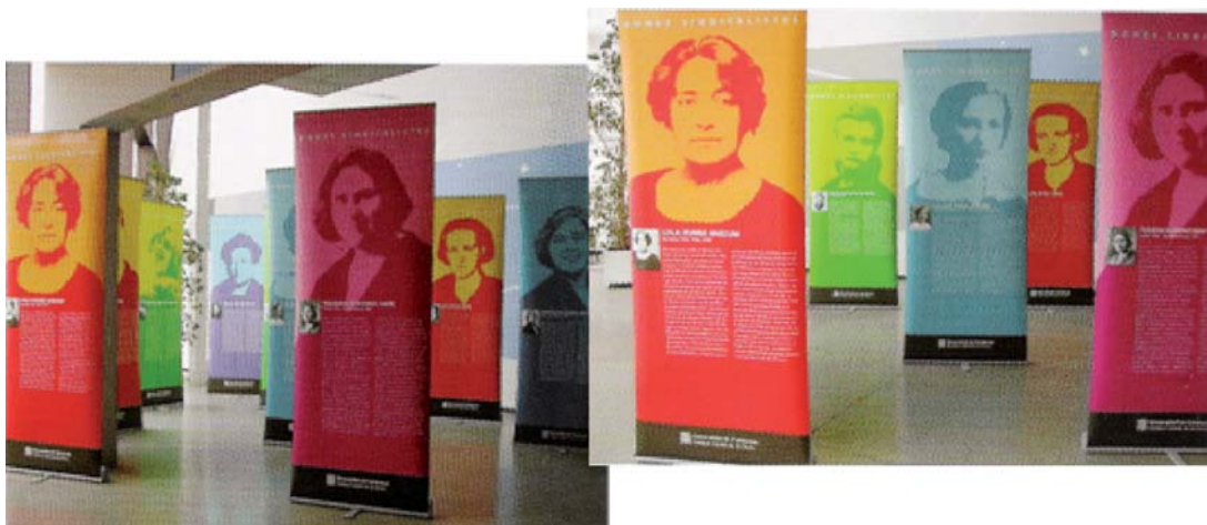
IMATGE E. Disseny de l'exposició «Dones sindicalistes». Institut Català de les Dones. Estudi Villuendas + Gómez, 2005.