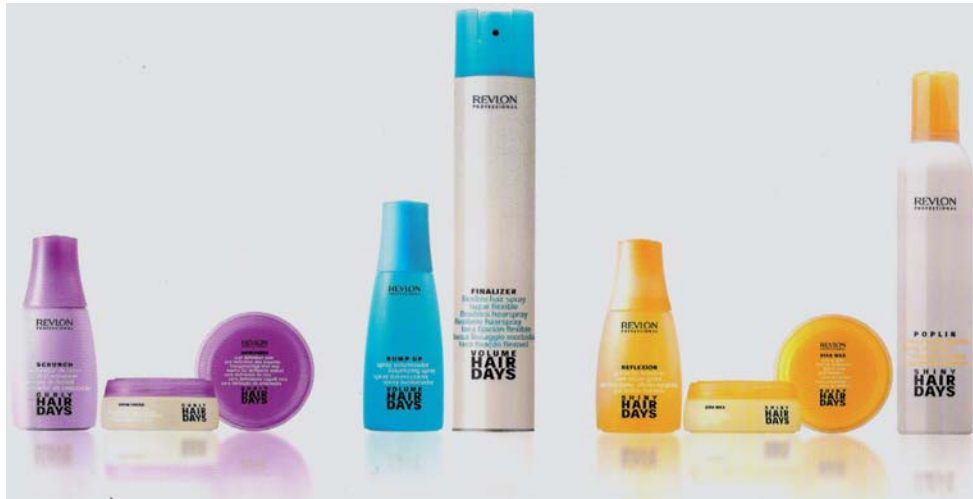
IMATGE H. Imatge gràfica de la línia de productes Hair Days, de Vicenç Marco i Associats.