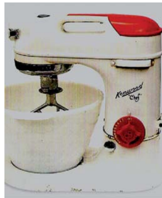
IMATGE B. Kenwood Chef, 1948.