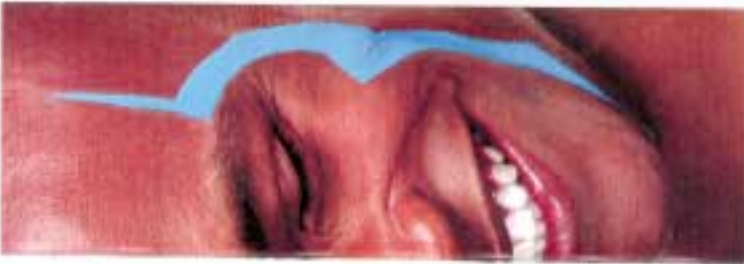
blue jelly skin