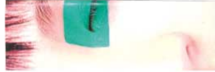
green jolly skin