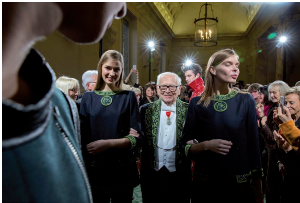
Fotografia feta durant la celebració del 70è aniversari de la carrera de Pierre Cardin, a l'Académie des Beaux-Arts de París. Bruno Barbey, 2016.

Observeu atentament la fotografia següent, obra del fotògraf Bruno Barbey, i responeu a les qüestions 2.1, 2.2 i 2.3.