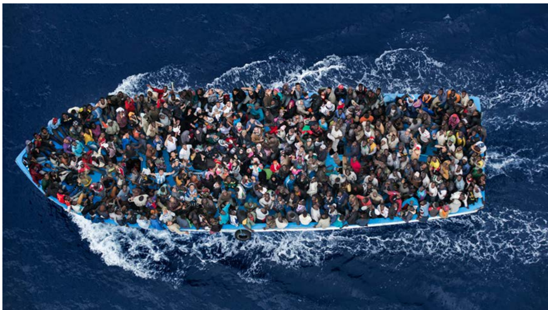
Rescue operation , Massimo Sestini, 2014.

Observeu atentament la fotografia següent, obra del fotògraf Massimo Sestini, i responeu a les qüestions 2.1, 2.2 i 2.3.