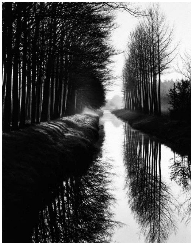
Canal , Brett Weston, 1971.