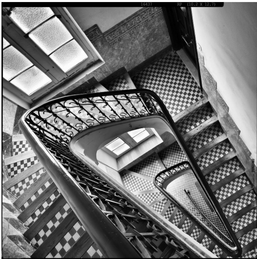
Relativitat , Rubén García Perdomo, 2012

Observeu atentament la imatge següent, del fotògraf tarragoní Rubén García Perdomo, i responeu a les qüestions 2.1 i 2.2.