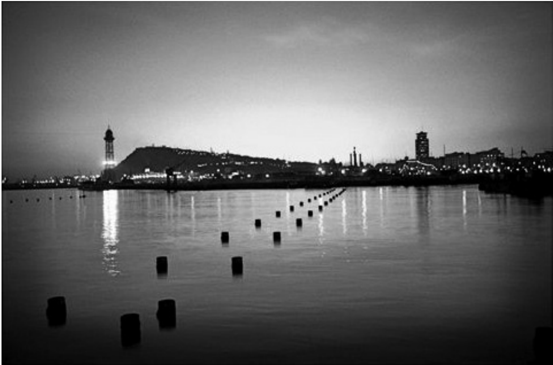
Port, Barcelona, Andreas Kierulf, 1994.

Observeu atentament la fotografia següent, obra del fotògraf català Andreas Kierulf, i responeu als apartats 2.1 i 2.2.