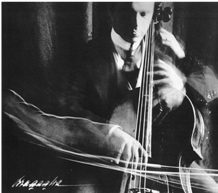
El violoncel·lista , A. G. Bragaglia, 1913.

Observeu atentament aquesta imatge, obra del fotògraf Anton Giulio Bragaglia, i responeu als apartats 2.1 i 2.2.