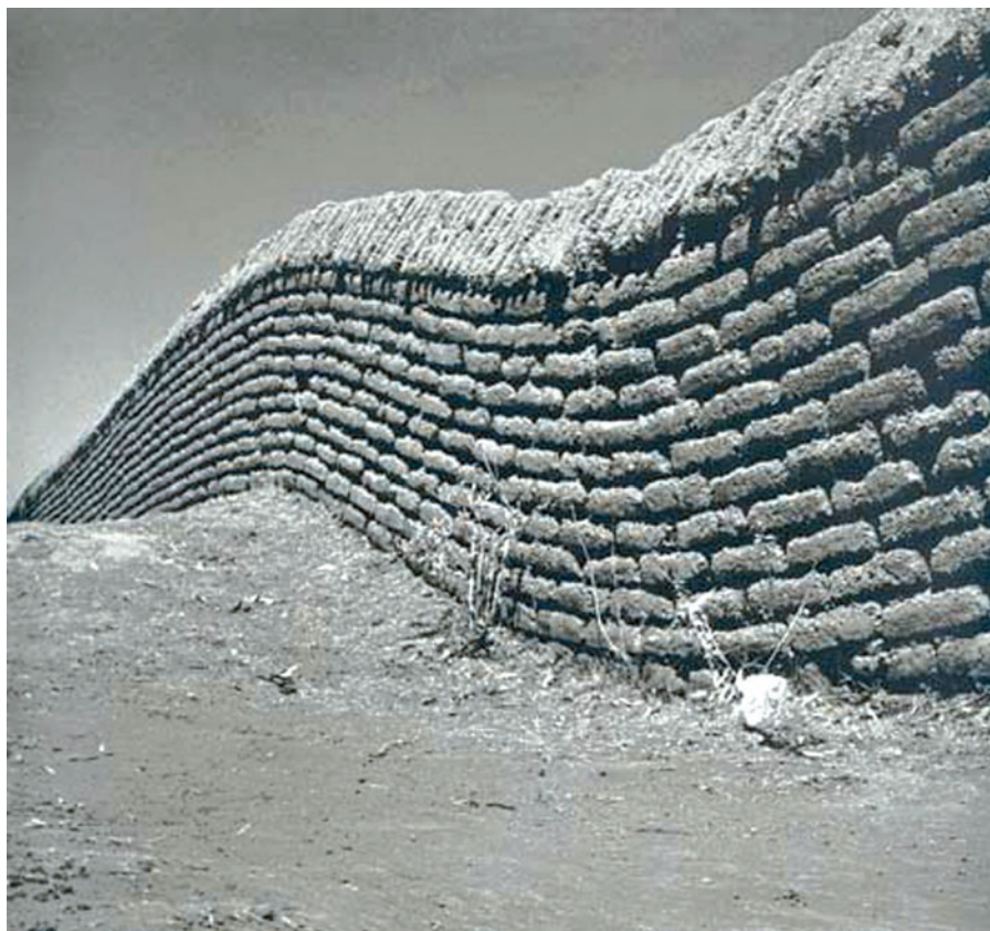
Barda tirada en un campo verde , Juan Rulfo, 1948.

Observeu atentament la fotografia següent, obra de Juan Rulfo, i responeu als apartats 2.1 i 2.2.